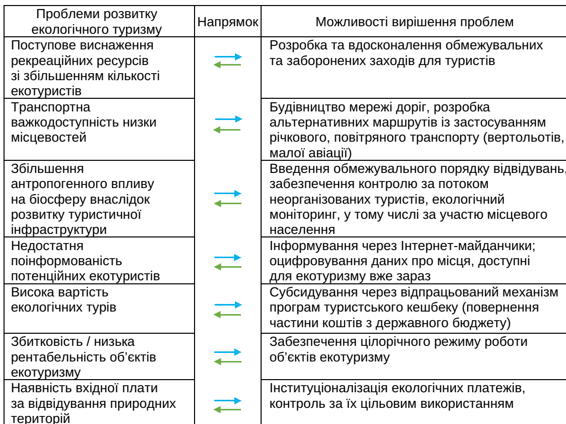
Рис. 1. Проблеми розвитку екологічного туризму в Україні та можливості їх вирішення

Еко туризм уже відкрив доступ до таких територій, які раніше були малодоступними для туристів, включаючи Арктику та Антарктику, важкодоступні області Амазонки, африканські та південноамериканські пустелі тощо [11]. Рекомендується доповнювати ці напрямки інноваційними заходами, спрямованими на поліпшення екологічного стану в регіонах. Природоохоронні території відіграють ключову роль у багатьох національних стратегіях, спрямованих не лише на охорону цих зон, але й на розвиток екологічно безпечного туризму. Згідно з рейтингом «True Luxury Travel», який оцінює 107 країн світу на основі критеріїв, таких як кількість національних парків, біорізноманіття, загроза вимирання видів, занесених до Червоної